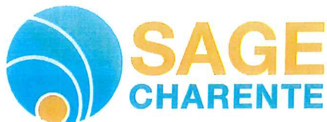
Schéma d'Aménagement et de Gestion des Eaux du bassin versant de la CHARENTE